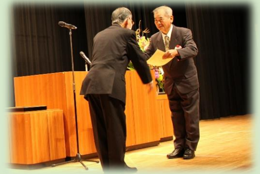
～個人ボランティア～