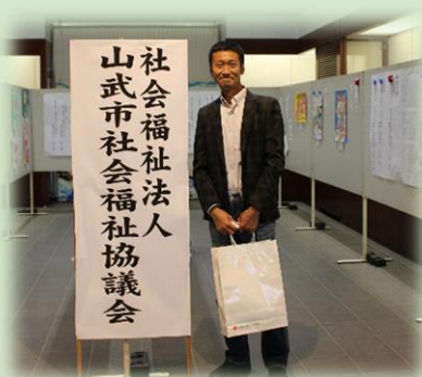
～ボランティアグループ～