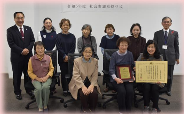
こだまお話し会さん

内閣府ではエージレス・ライフ（年齢にとらわれず自らの責任と能力において自由に生き生きとした生活を送ること）を実践している高齢者の事例（「エージレス・ライフ実践事例」）や、地域で社会参加活動を積極的に行っている高齢者のグループ等（「社会参加活動事例」）を募集し、その中から内閣府として紹介する事例を決定し広く紹介することにより、国民の参考としていただくことを趣旨としています。