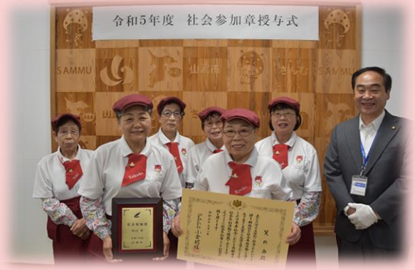
笑の会 (BaBa ピザ)さん